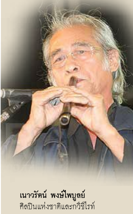
เนาวรัตน์ พงษ์ไพบูลย์ ศิลปินแห่งชาติและกวีซีไรต์

@ มันมาเร็วมาล้นจนมาล้า ต่างโหนห้อยต้อยต่ำตามประสา หกดะเมนเค้นคลังดีลังกา อนิจจา...สังเวชประเทศไทย!