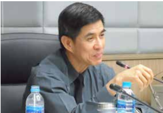
• นพ.สุวิทย์ วิบุลผลประเสริฐ

นพ.สุวิทย์ วิบุลผลประเสริฐ ประธานคณะกรรมการดำเนินการจัดสมัชชาปฏิรูป (คจสพ.) กล่าวว่า ตามที่ คจสพ. ได้กำหนดประเด็นที่จะบรรจุเป็นระเบียบวาระ สมัชชาปฏิรูประดับชาติครั้งที่ 3 ระหว่างวันที่ 31 พฤษภาคม - 2 มิถุนายน 2556 จำนวน 6